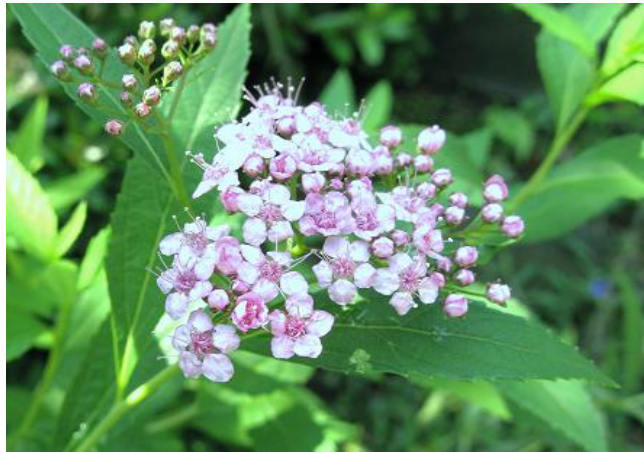
京鹿の子(キョウカノコ) / 撮影・題字 倉林順一

◇若い人々の力をどのように結集するかがカギのようですが、少し真面目に考え、協力したいと思っています。