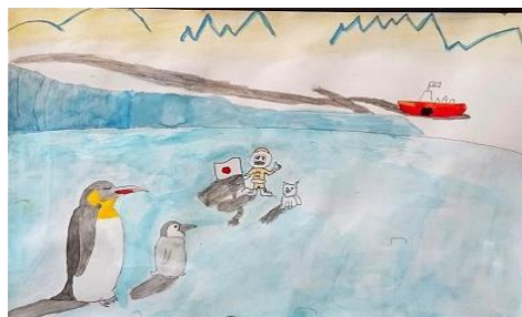
「ペンギンに会いたい」小5