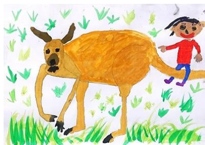
「カンガルーの大冒険」小6