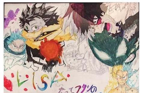
「あたしのヒーロー」高2