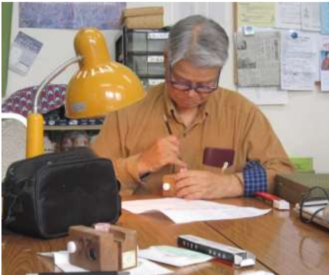
篆刻に挑戦：スタジオ楽書会