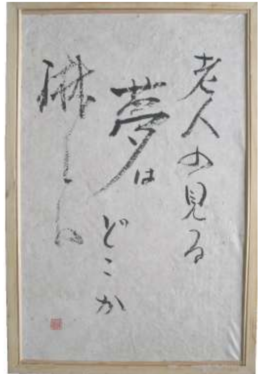
額も詩も自作：退職教職員作品展出品